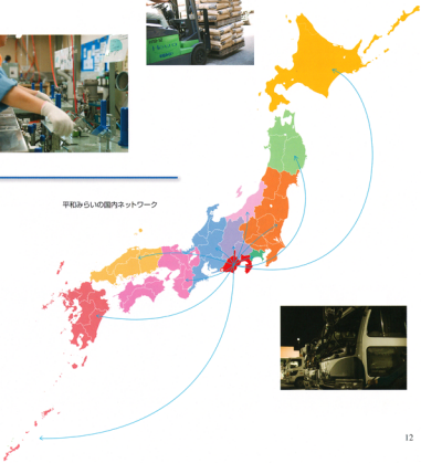
平和みらいの国内ネットワーク

平和みらいでは、従来の自社倉庫を中心とした物流にとどまらず、お客様の工場内に入って物流業務全般を請け負うサービスや、自動車部品の一部組み立て、工場内に搬入した原料の充填作業などのアウトソーシング業務も展開しています。平和みらいへの信頼が生み出す、攻めのパートナーシップです。